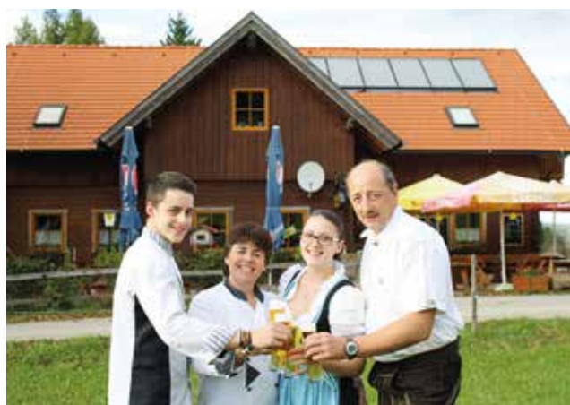
Fam. Lenz, Holzschlag 23, 2565 Neuhaus