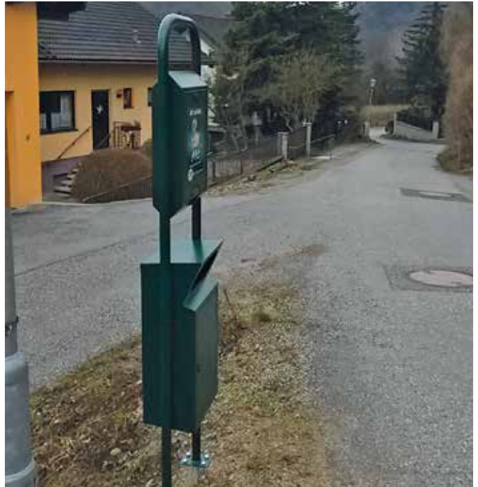
Hundesackerl-Automat in Alland

Für viele Bauern im Biosphärenpark - von Königstetten über Breitenfurt bis Alland - ist dies bereits ein ernstes Problem. Sie wollen daher aufklären. Ob im direkten Gespräch, auf Tafeln oder im Mitteilungsblatt: Hundekot auf Wiesen ist nicht nur unhygienisch, er gefährdet auch die Tiergesundheit, egal ob für Rinder, Schafe oder Pferde. Die Häufung von Totgeburten bei Rindern aufgrund von Hundekot