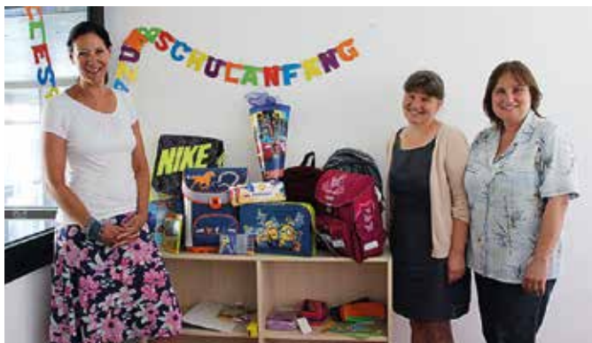
Gemeinsame Aktionen für Bedürftige

Ein arbeitsreiches und erfolgreiches Jahr liegt hinter uns. Durch unsere Aktionen haben wir zahlreichen Menschen, vor allem Familien mit Kindern, helfen und Freude bereiten können. Auch für heuer haben wir uns wieder einiges vorgenommen: