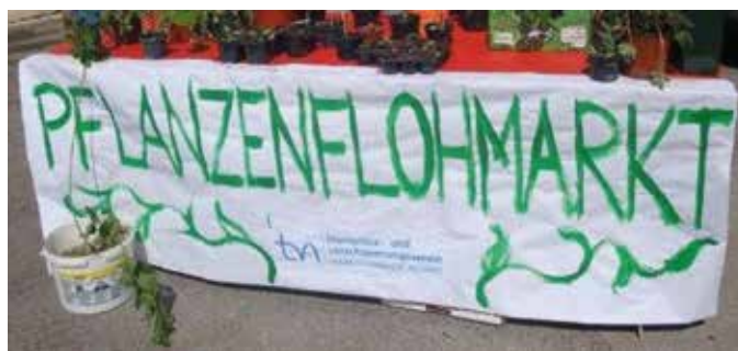
Am 6. Mai im Gemeindepark