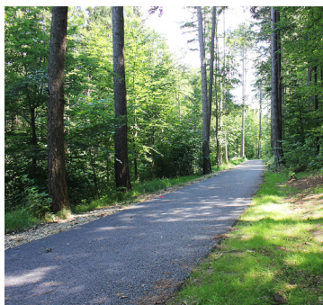
Der Radweg wurde bereits freigegeben.