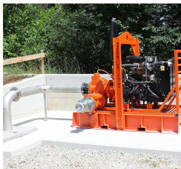
Die neue leistungsstarke Dri-Prime-Pumpe.