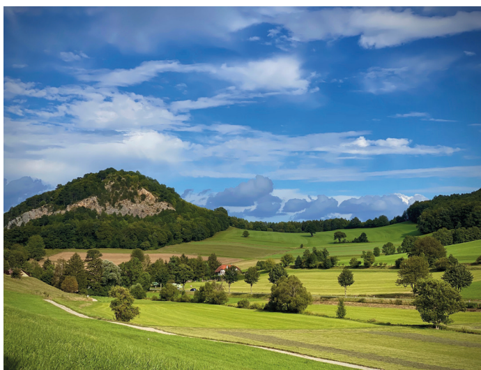
Einen grandiosen Blick auf den Buchberg hat Frau Rebecca Gröttschel eingefangen.

grafien und Eindrücke. Bis zum 5. Mai 2023 über-sandte Bilder werden für die neue Ausgabe des Mitteilungsblattes gerne wieder verwendet. Ein herzliches Danke für die rege Beteiligung und die wunderschönen Fotos aus der Marktgemeinde Alland.