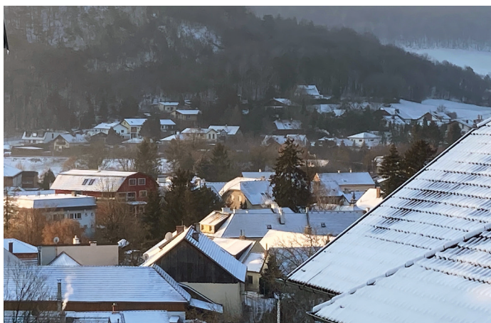
Eine herrliche Winterstimmung mit Blick auf den Buchberg wurde von Familie Hackl aufgenommen.