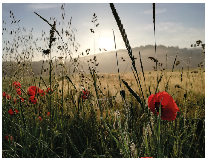
Barbara Winkler fotografierte ein tolles Farbenspiel aus Mohnblumen, Getreide und Sonnenstrahlen.