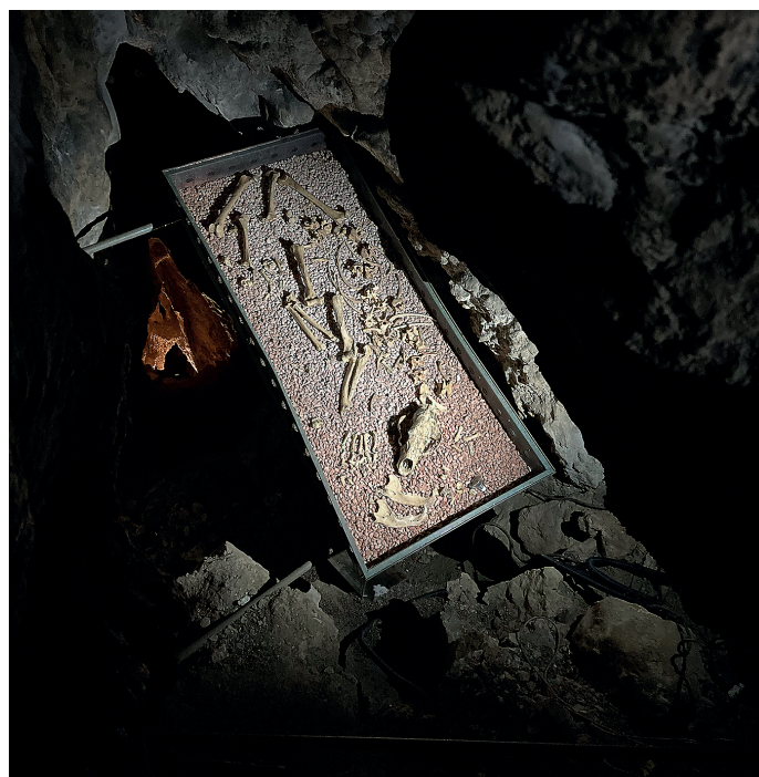
In der Höhle findet sich das weitestgehend vollständige Skelett einer mehr als 10.000 Jahre alten Braunbärin.